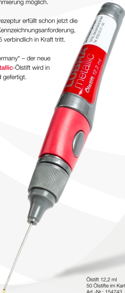
Ölstift 12,2 ml 50 Ölstifte im Karton Art.-Nr.: 154743

Den passenden Schmierstoff für Ihr Fahrzeug finden Sie unter: www.schmierstofffinder.de